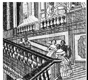
ヴェルサイユ宮殿 (銅版画)

後半は、現実世界の厳しい状況である、中国の南沙諸島進出行動を歴史から見てどのように捉えるべきか話し合った。(難波 康熙)