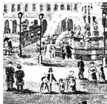
コンコルド広場 (銅版画)

戦争の根源は、『食と安全保障の確保』にある。戦争は、政治の延長で、最後は力が解決する。戦争の形態には