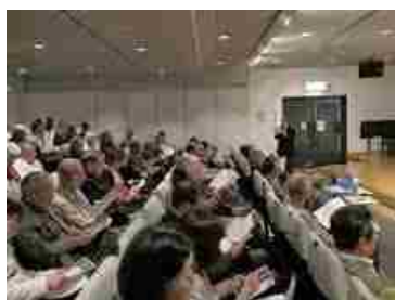
満席の浦安市民プラザ (4月19日・新浦安)