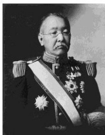
将軍徳川家斉の孫 駐仏公使 北海道で農場経営

第13代藩主・蜂須賀斉裕（第11代将軍・徳川家斉の22男）の次男。幼名：氏太郎。後に従兄弟で14代将軍・徳川家茂の偏諱を賜り、茂韶と名乗る。慶応4年（1868）鳥羽・伏見の戦いの最中に父の死に遭い、家督を継ぐ。その混乱もあり、戊辰戦争では徳島藩は十分な活躍が出来ずに、諸藩からの批判も浴びる。将軍家に近すぎたので、身動きが難しかったともいえよう。明治になって、議定、刑法官事務局輔、左近衛権中将、権中納言、民部官知事、徳島藩知事と目まぐるしく役職が替わり、明治4年の廃藩置県には率先して版籍奉還に応ず。明治5年には、岩倉使節団を追うように、小室信夫らを伴い渡英し、ロンドンで使節団に会う。オックスフォード大学に留学し、7年後の明治12年（1879）大学卒業帰国して、外務省御用掛に任官する。翌年、大蔵省関税局長（三等出仕）。明治15年参事院議官、勲三等となり、法制部勤務後、同年12月に駐フランス特命全権公使として赴任する。スペイン、ベルギー、スイス、ポルトガル公使も兼務。在任中侯爵を授爵し、明治19年帰国する。明治20年元老院議官（勅任官一等）を任官。その後も、第11代東京府知事兼東京市長（1890 - 1891）、第2代貴族院議長（1891 - 1896）、第二次松方正義内閣の文部大臣、枢密顧問官を歴任する。麿香間祇侯待遇。